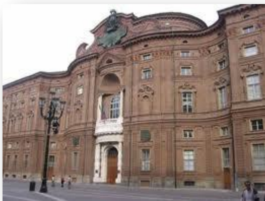
Palazzo Carignano - Museo del Risorgimento