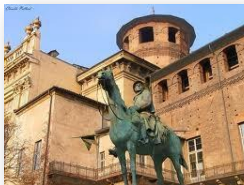
Piazza Castello, Monumento al Cavaliere