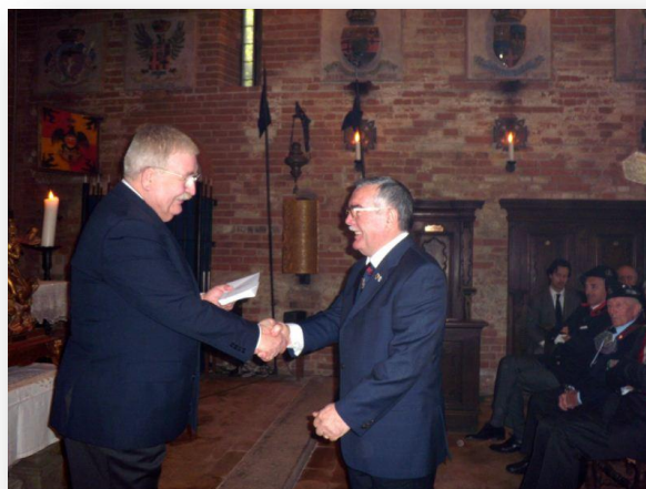
La consegna della tessera al patrono Bergamaschi

Gli Stendardi delle Sezioni prendono ora posto dietro l'altare: c'è Voghera, Milano, Lodi, Mantova, Reggio Emilia, schierate a fianco a quello dell'UNUCI, dell'Associazione Nazionale Carabinieri e delle volontarie della Croce Rossa Italiana di Voghera.