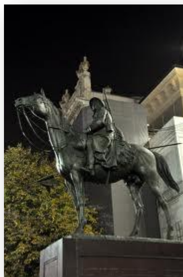
Monumento al Cavaliere - Notturmo