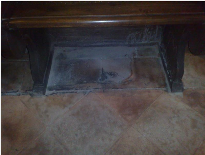
Particolare del pavimento del Tempio

non poco l'aspetto generale agli occhi dei numerosi visitatori che hanno ripreso a frequentarlo.